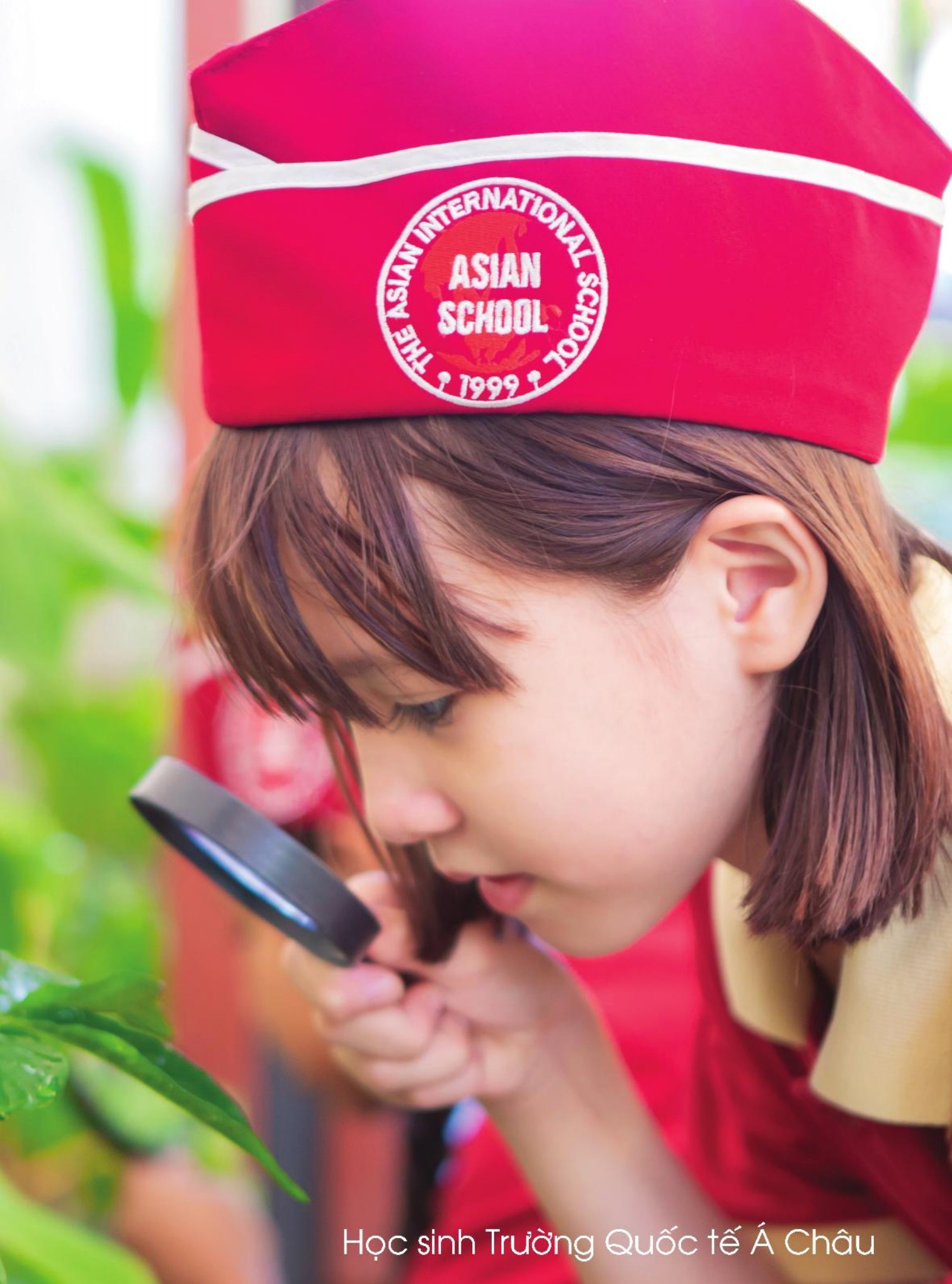
Học sinh Trường Quốc tế Á Châu