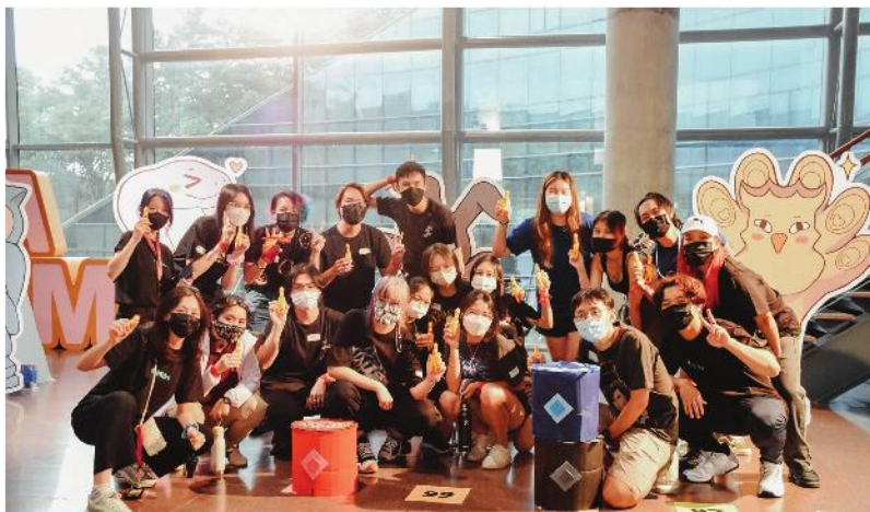
Không chỉ đứng thứ 30 trong danh sách Best Global University, Nanyang Technological University còn nằm trong top 3 đại học ở Châu Á theo xếp hạng của U.S. News & World Report 2022.

Kỳ) và Savannah College of Art & Design với mức học bổng $78.000. Em đã chọn ngành Art, Design and Media tại Nanyang Technological University (NTU) - Singapore và hiện đang là sinh viên năm nhất.