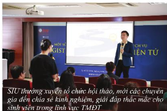
SIU thường xuyên tổ chức hội thảo, mời các chuyên gia đến chia sẻ kinh nghiệm, giải đáp thắc mắc cho sinh viên trong lĩnh vực TMĐT

điện tử, ứng dụng CNTT trong thương mại điện tử, video - đồ họa cùng hàng loạt các trải nghiệm thực tế rất thú vị; được giao lưu học hỏi kinh nghiệm từ các chuyên gia hàng đầu trong nước và quốc tế.