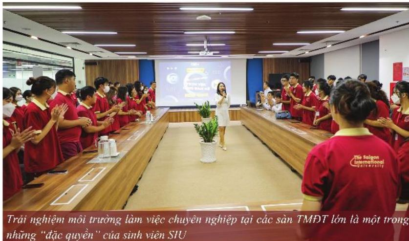
Trải nghiệm môi trường làm việc chuyên nghiệp tại các sàn TMĐT lớn là một trong những "đặc quyền" của sinh viên SIU

Khi theo học Thương mại điện tử của SIU, sinh viên được đào tạo và trau dồi kỹ năng chuyên môn quan trọng thuộc nhóm kinh doanh - marketing, thương mại