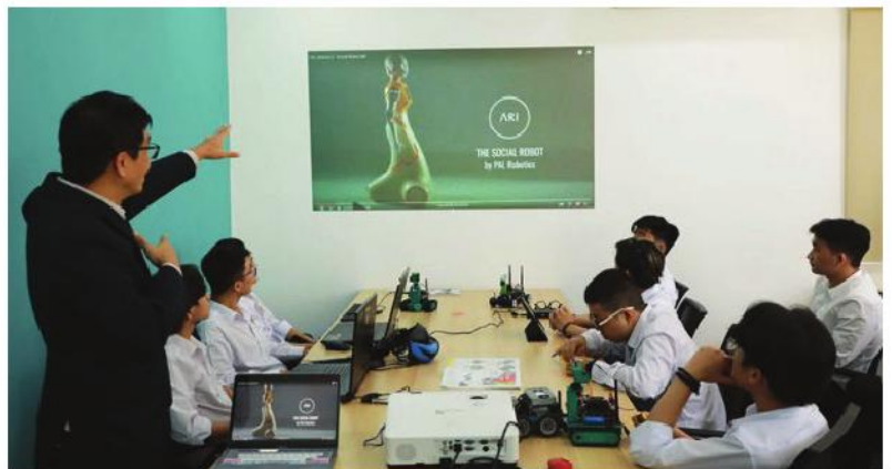
Giảng viên SIU đồng hành cùng sinh viên trong các dự án chuyên ngành tại SIU AI Lab

Công nghệ và AI đã và đang thay đổi diện mạo của nền giáo dục toàn cầu, thúc đẩy xu hướng đào tạo “tinh hoa” đáp ứng yêu cầu thời đại. Đây là mục tiêu mà chương trình phát triển tài năng tại SIU hướng đến đào tạo các thế hệ nhân lực chất lượng cao phục vụ cho sự phát triển chung của đất nước. 🌐