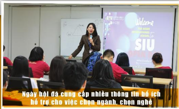
Ngày hội đã cung cấp nhiều thông tin bổ ích hỗ trợ cho việc chọn ngành, chọn nghề

Tại SIU Open Day 2023, các em học sinh còn được tham gia hoạt động tư vấn hướng nghiệp với nhiều thông tin cần thiết như: phương thức xét tuyển, chương trình đào tạo, chính sách học bổng, phong cách học tập ở môi trường đại học quốc tế và triển vọng nghề nghiệp sau tốt nghiệp... Từ đó, các em có thể hình dung rõ hơn về nghề nghiệp, biết thêm những kỹ năng, tố chất cần có và thử thách cần vượt qua để chọn đúng ngành đúng nghề. 🌐