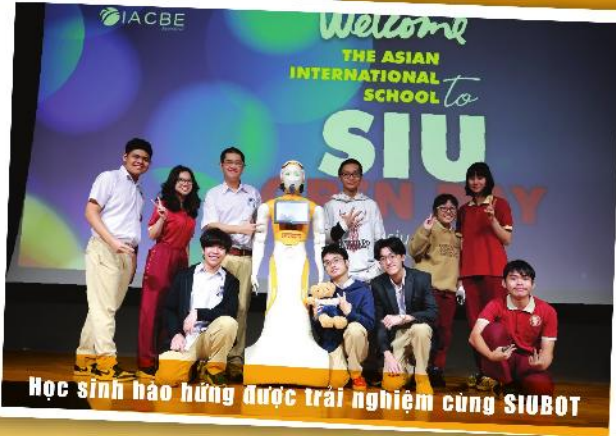
Học sinh hào hứng được trải nghiệm cùng SIUBOT

Chủ động, tự tin và thích khám phá, học sinh Asian School đã có những khoảnh khắc “hóa thân thành SIUers” vô cùng đáng nhớ với loạt trải nghiệm thú vị tại ngày hội SIU Open Day.